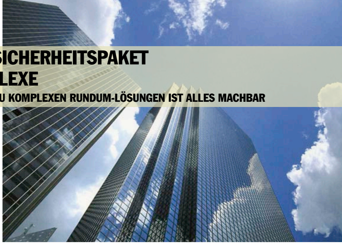
Große Bürogebäude fordern innovative Lösungen im Service- und Sicherheitsbereich

Gefragt sind Systeme, die neben einer Netzwerk- und Kommunikationsinfrastruktur eine Sicherheitsleitstelle, eine Videoüberwachung und ein Zutrittskontrollsystem beinhalten. Um diese Anforderungen zu erfüllen, werden bis heute oftmals Insellösungen – also nicht miteinander verbundene oder gar vernetzte Tools – eingesetzt. Diese haben jedoch den Nachteil, dass alle notwendigen Daten an mehreren Systemen in Datenbanken eingepflegt werden müssen und somit nicht zentral koordinierbar sind. Bewährt haben sich web-basierte Lösungen, die die Verknüpfung zwischen Video-, Gegensprechsystemen, technischen Anlagen und Einbruchmeldeanlagen ermöglichen. Die durch das Managementsystem einfach zu realisierende Zugangskontrolle bietet viele Vorteile: So wird nur